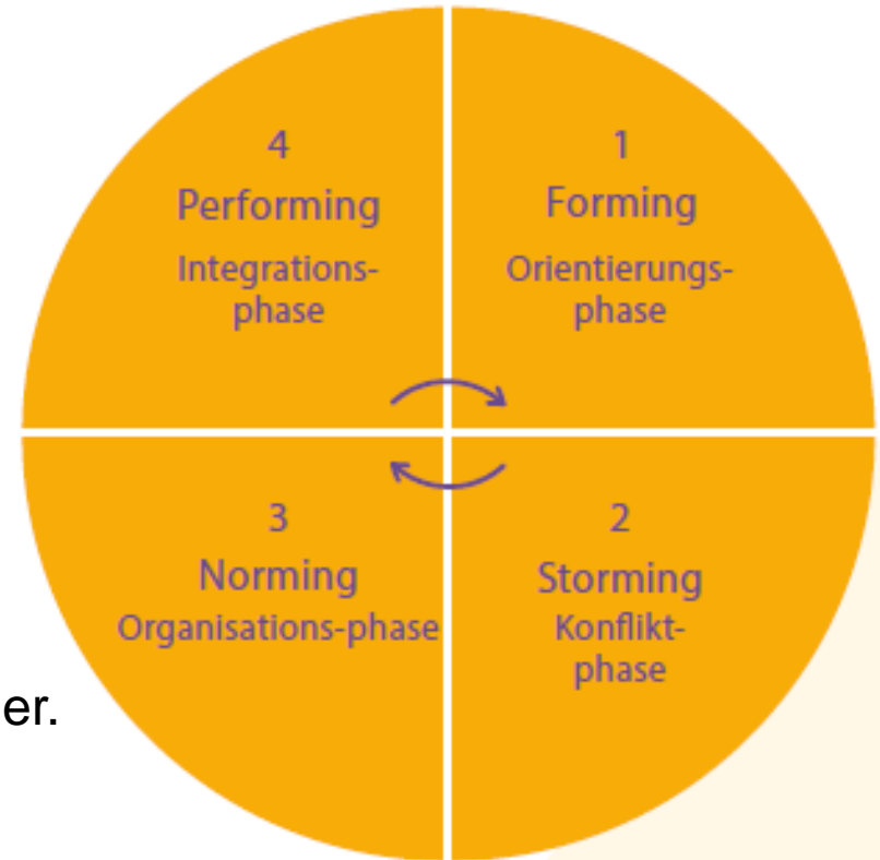
Phasenmodell nach B. Tuckman

❖ Das Team hat sich gefunden und kann arbeitet effizient.